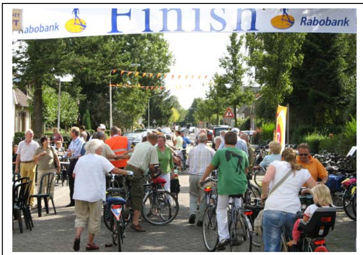
Gezellig druk bij start en finish,

Wederom stellen we een mooie prijs samen voor de 1000 ste inschrijving. Vorig jaar hebben we de 1000 inschrijvingen net gehaald. Wie weet bent u de 1000 ste inschrijving dit jaar.